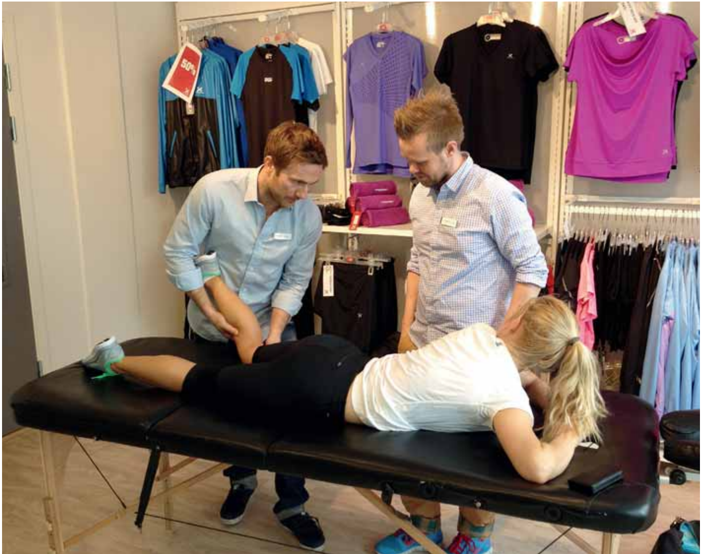
SECOND OPINION Problemet til pasienten blir ofte vurdert også av en manuellterapeut nummer to. Her fra treningssenteret vegg i vegg.